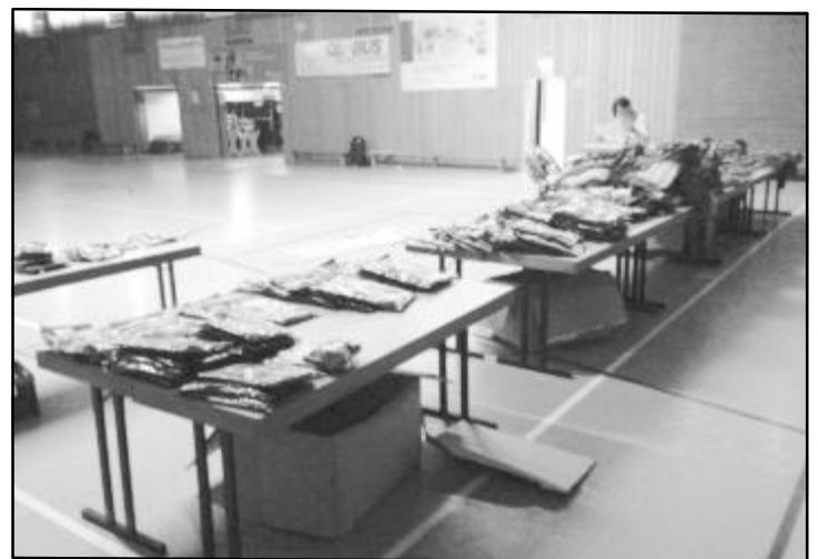
Die Ausgabe der Bekleidung ist vorbereitet - der Ansturm sollte gleich folgen.

Historisch sind auch die schwarz-magenta Trikots, in denen zahlreiche Erfolge gefeiert wurden, doch auch bei Niederlagen wurden sie getragen. Ihre Zeit als Spieltrikot ist nun abgelaufen. Seit der neuen Spielzeit treten die aktiven Teams in der Vereinsfarbe blau an die Tische. Auch in ihnen wird sich mancher über Siege freuen und mancher über Niederlagen ärgern, doch das ist der Sport.