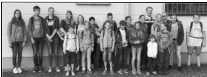
Gruppenbild vor der Abfahrt.

(ulf) Morgens um 9:00 Uhr trafen sich 19 Kinder und fünf Erwachsene an der DJK-Halle und nach dem obligatorischen Gruppenbild ging es wenig später im Bus Richtung Südwesten. Ziel des diesjährigen Kids-Ausfluges war der Holiday Park im pfälzischen Haßloch.