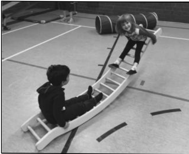
Zwei Kinder haben zusammen Spaß.

(ulf) Freitagnachmittags erklingt aus etwa 15 Kinderkehlen in der DJK-Halle in der Heinrich-Heine-Straße: „Eins, zwei, drei, vier - wir sind heute alle hier! Fünf, sechs, sieben, acht - wir turnen bis es kracht!“. Los geht's mit 60 Minuten Kinderturnen für Kids zwischen drei und sechs Jahren.