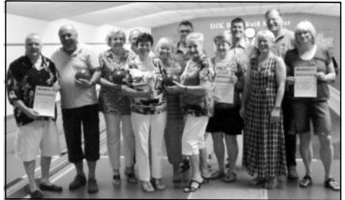
Siegerehrung am Ende einer heißen Woche.

Bei den Herrenmannschaften waren die Dritt- und Zweitplatzierten mit 638 Kegel punktgleich, doch die "Kugelschieber Herren" hatten das bessere Räumungsergebnis, sodass die Herren vom Tennisclub den dritten Platz belegten. Mit einem deutlichen Abstand (719 Kegel) konnten die Herren der Wandergesellschaft "Frisch auf" ihren Titel