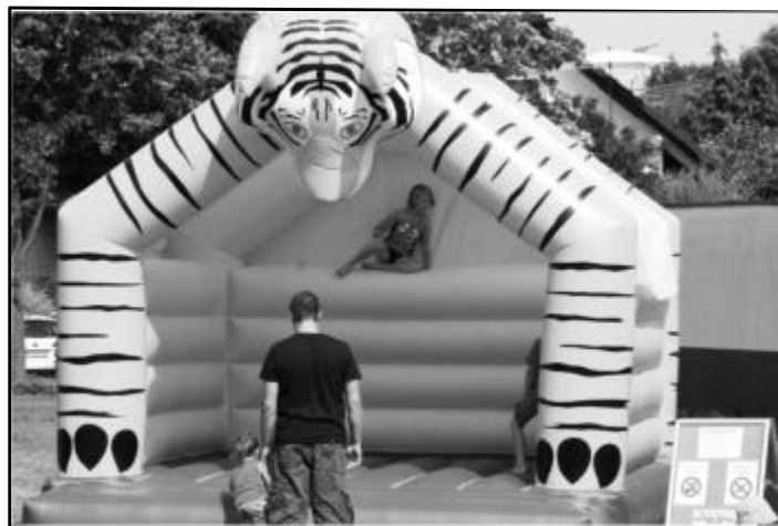
Die Hüpfburg war das Zeil der kleinen DJKler.

Besonders die Jüngsten kamen beim Familienfest nicht zu kurz. Die Hüpfburg wurde kräftig bespielt. Zahlreiche Kindergesichter verwandelten sich den Nachmittag über in Zebras oder Tiger. Bei hochsommerlichen Temperaturen waren die Wasserspiele eine beliebte Erfrischung. Apropos Erfrischung: Eis durfte auf der DJK-Speisekarte ebenso wenig fehlen wie Kaffee und Kuchen für die Süßmälchen. Aber auch die Liebhaber der deftigen Küche kamen mit Steaks und Wurst vom Grill voll auf ihre Kosten. Je später der Abend wurde desto beliebter wurde die Cocktailbar, ehe der Abend mit einer kleinen Party in der DJK-Gaststätte ausklang.