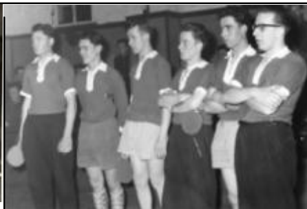
Saison 1959/60 Meister der Gruppenliga Süd