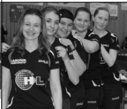
Saison 2012/13 Meisterschaft Regionalliga