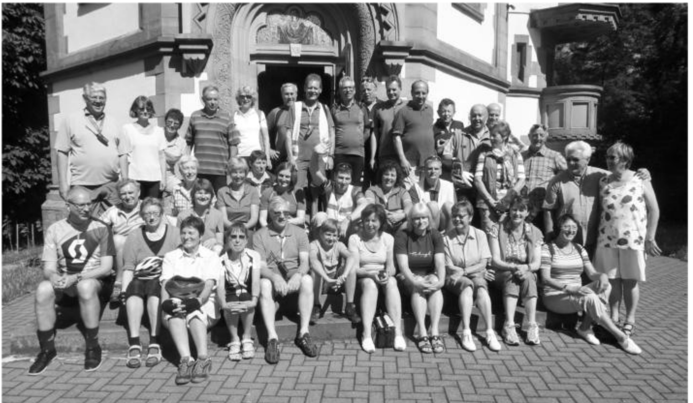
Die DJK-Wallfahrer haben sich zum Gruppenfoto formiert.

Dies hatte sich gelohnt: Der Himmel klarte immer mehr auf und die Sonne trocknete nach und nach die regennassen DJKler. Zur Mittagspause strahlte die Sonne auf der Sonnenterrasse eines italienischen Restaurants. Doch die Wetter-App kündigte gegen 15:00 Uhr ein starkes Gewitter an und so ging es zügig wieder auf die Sättel. Doch auch das nutzte nicht viel: Der Starkregen holte den DJK-Tross ein. Tropfnass wurde die nächste Auszeitstation, die Katholische Kirche St. Leo der Große in St. Leon-Rot, erreicht. So hinterließen die Blau-Weißen dort