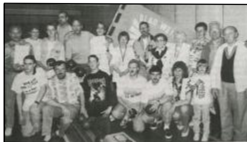
Das DJK-Aufgebot bei den Bundesmeisterschaften.

Die noch junge Kegelabteilung hatte auch weitere Verantwortung übernommen. So wurden die 18.