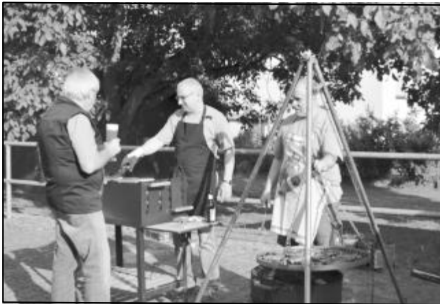
Die Grillmeister haben alles im Blick.

(mst) Samstagsabends nahmen über sechzig Personen am diesjährigen Grillfest der DJK Blau-Weiß Münster Sportkegelabteilung teil und von den ganz kleinsten der Abteilung bis zu den ältesten Sportkegler und deren Familien, fühlten sich alle sehr gut unterhalten. Zu Beginn wurde für das leibliche Wohl mit Steaks und Würstchen vom Schwenkgrill und diversen Salaten gesorgt und im Anschluss folgte die Ehrung der Vereinsmeister.