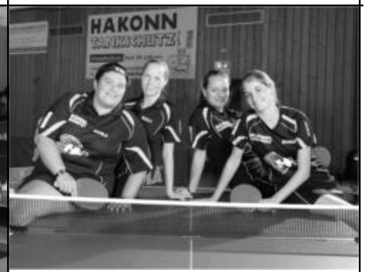
Saison 2013/14 1. Damen in 2. Bundesliga