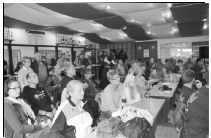
Zahlreiche Zuschauer ließen sich das Topspiel nicht entgehen.

Zahlreiche Zuschauer fanden an diesem Tag den Weg in die DJK-Halle und sorgten so dafür, dass das Jubiläum der Kegelabteilung einen würdigen Rahmen erhielt. Viele ehemalige Kegler, viele DJKler aber auch einige Nichtkegler und Nicht-DJKler haben, durch ihr Kommen, zum Gelingen der Veranstaltung entscheidend beigetragen. Nun freuen sich die Sportkegler der DJK Blau-Weiß Münster auf eine spannende und hoffentlich erfolgreiche Saison, die am kommenden Wochenende starten wird.