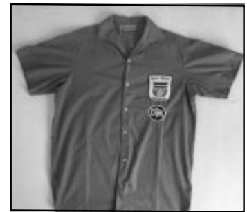
Am Anfang war das Herren-Oberhemd.

(ulf) Tischtennistrikots bei der DJK könnten jede Menge Geschichten aus der Vergangenheit erzählen, wenn sie denn erzählen könnten. Doch da es in diesem Sommer neue Trikots gab, ist Zeit einmal auch einen Blick auf die Vorgänger zu werfen.