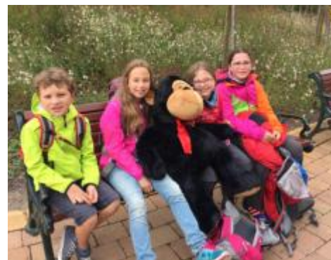
Toller Tag im Holiday Park