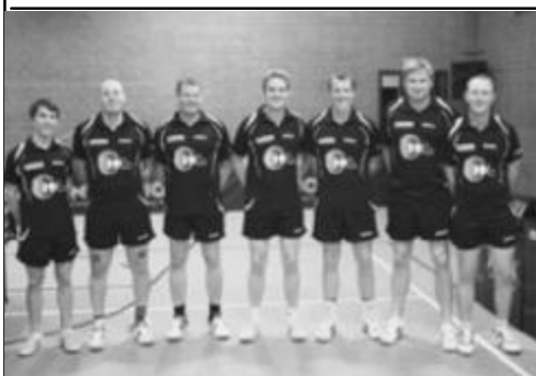
Saison 2011/12 Rossi kehrt zurück