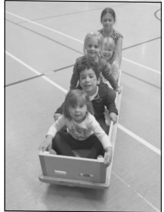
Zu fünf sind wir stark.

ppes „Spiel und Spaß ab einem Jahr“ angeknüpft und gleichzeitig die Lücke im Vereinsangebot geschlossen. Die Mädchen und Jungen machen eigene Erfahrungen, ihre Selbstständigkeit wird ebenso gefördert wie