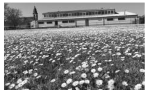
Wer im April zur Halle kam, konnte es live sehen.

wieder etwas gewinnen. Wer gewonnen hat und das richtige Lösungswort steht in der nächsten Ausgabe. Viel Spaß beim Sammeln, Sortieren und Raten!