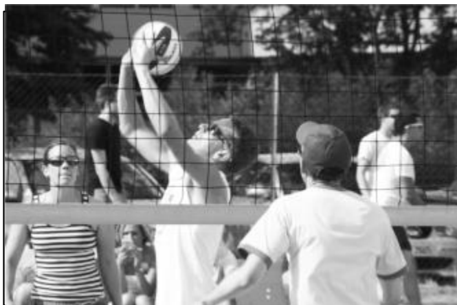
Es wurde um jeden Punkt gekämpft.

(ulf) Im Sommer fand zum dritten Male ein Beachvolleyball-Turnier statt. Erstmals kombiniert mit einem Familienfest. Und die Premiere konnte sich sehen lassen.