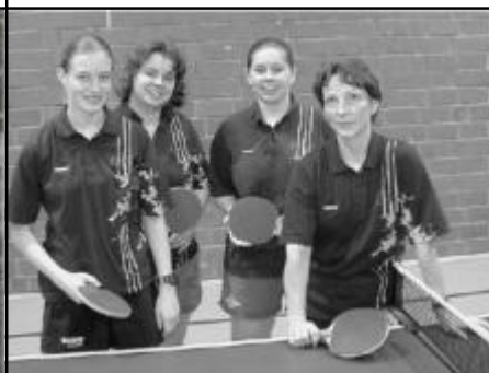
Saison 2000/01 Meisterschaft Hessenliga