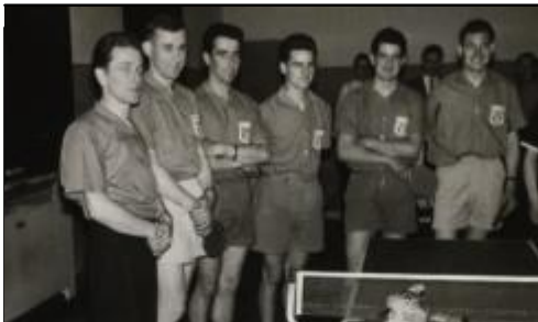
Saison 1957/58 Aufstieg in die Gruppenliga Süd