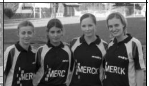
Saison 2005/06 Meisterschaft Oberliga