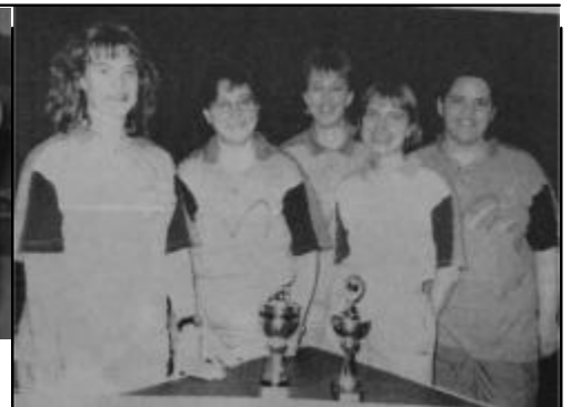
Saison 1996/97 Hessenpokalsieg 6. Damen