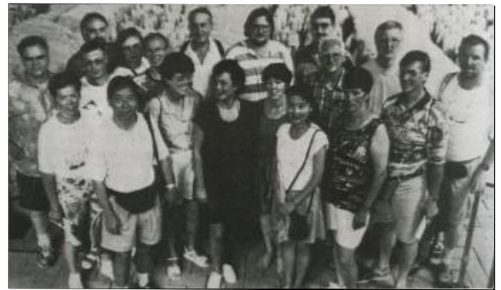
DJKler in China.

Die Wallfahrt und die Tour nach Hamburg waren aber „nichts“ gegen die große Chinafahrt der DJK über die in der November-Ausgabe berichtet wurde. Rund drei Wochen waren 20 DJKler beziehungsweise Freunde der DJK im Land der aufgehenden Sonne unterwegs. Angeregt vom damaligen Trainer Liu Liping wurden die Sehenswürdigkeiten Chinas erkundet: Peking, die Große Mauer, die Terrakotta-Armee, Chengdu, eine Li-Flussfahrt und Shanghai. Zurück ging es mit vielen Erinnerungen und zahlreichen Bildern und Dias im Gepäck.