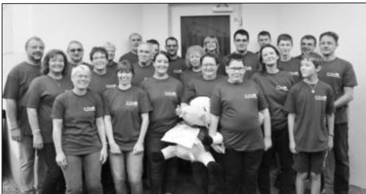
Ein starkes Team - die zahlreichen Helferinnen und Helfer.