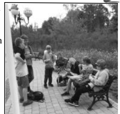
Pause muss auch mal sein.