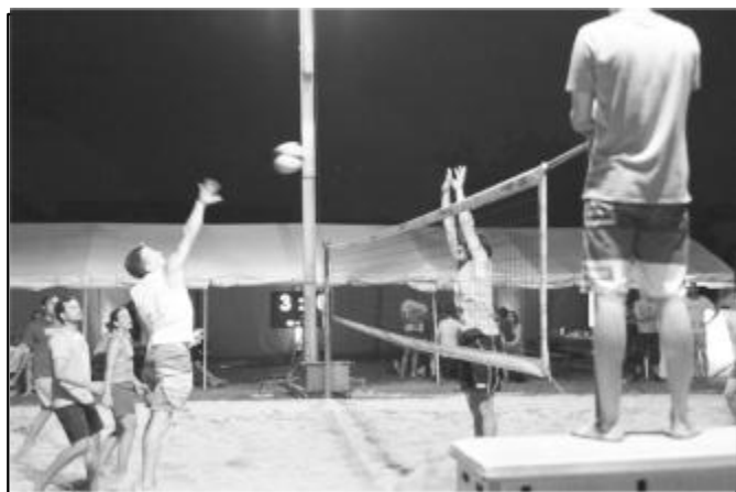
Das Finale wurde unter Flutlicht gespielt.

Den Sieg holte sich das Team „Kamu“, das sich vor zwei Jahren noch im Finale hatte geschlagen geben müssen. Unterlegen waren im Endspiel die „Blockbusters“, auch sie standen vor zwei Jahren – als „Frankie goes to Hollywood“ gewannen – bereits auf dem Treppchen. „Taschen voll Sand“ wurden Dritte.