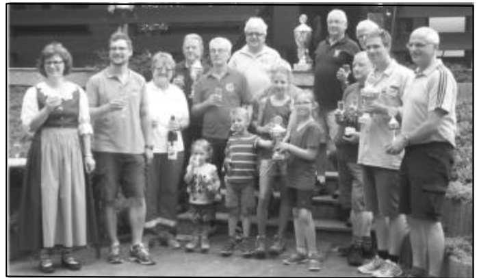
Die jungen DJKler dürfen den Pokal beim Volkswandern in Empfang nehmen.

Das Volksradfahren wird wahrscheinlich in die Geschichte eingehen. Eine Person zu wenig war für die DJK am Start, um mit der siegreichen Feuerwehr gleich ziehen zu können. Nach zwei Siegen in den beiden vergangenen Jahren blieb dieses Mal den 73 DJKlern nur Platz zwei.