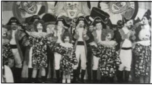
Das großes Finale.

In der ersten Ausgabe des Jahres 1995 blickt man auf eine erfolgreiche Fastnachtskampagne zurück. Die