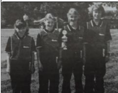
Saison 1997/98 Südwestdeutsche Meisterschaft