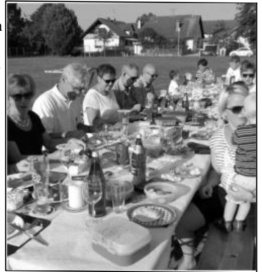
Gelungene Premiere vor der DJK-Halle.

samen Abendessen unter freiem Himmel wurde erzählt, probiert und natürlich wurden auch Rezepte ausgetauscht. Bis in die späten Abendstunden hatten alle ihren Spaß.