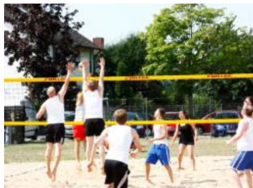
Spannende Duelle im heißen Sand