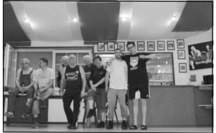
Nach getaner Arbeit.

Schon am Freitagnachmittag ging es mit vereinten Kräften los. An diesem Tag bekamen die Wände sowohl im Innen- als auch im Außenbereich einen neuen Anstrich und mit verschiedenen Farben sind neue Akzente gesetzt worden. Es wurde in allen Ecken, Schränken und Schubladen geschaut, um dort für Ordnung und Sauberkeit zu sorgen und auch die erneuerte Beleuchtung sorgt nun dafür, dass das Vereinsheim im schönsten Licht erstrahlt. Am Samstag in der Frühe lag das Hauptaugenmerk auf den Bahnen. Nachdem neue Seile zurecht geschnitten und an den gesäuberten Kegel angebracht waren, sieht es nun so aus, als ob die Kegel von Geisterhand nach oben gezogen werden. Die Bahnen sind vom alten Schmodder befreit worden und in vielen verschiedenen Arbeitsschritten kam ein neuer Belag drauf, den alle Beteiligten als sehr gelungen beschreiben. Natürlich brummte auch