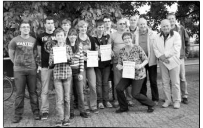
So sehen Siegerinnen und Sieger aus.