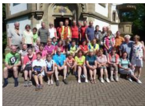
Regen kann die Stimmung nicht trüben